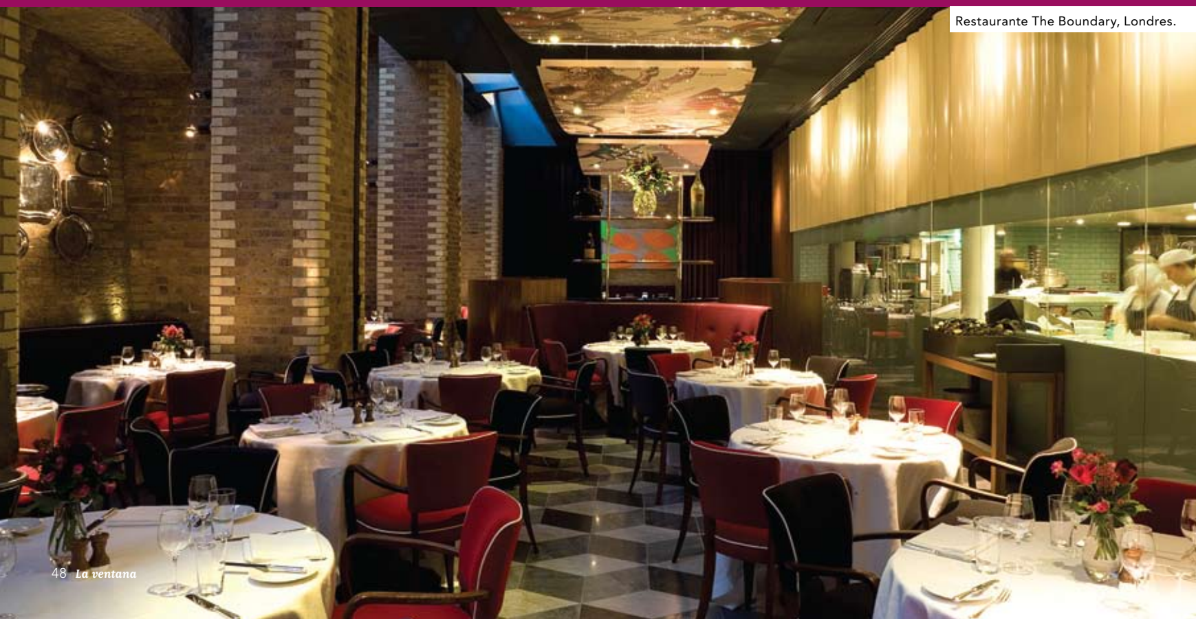
Restaurante The Boundary, Londres.

TEXTO: VICTORIA GRADÍN