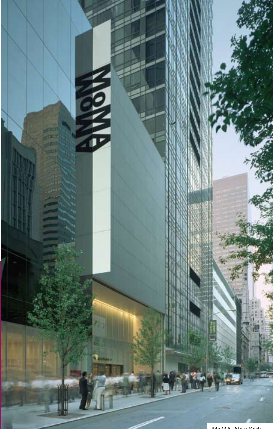
MoMA, New York.