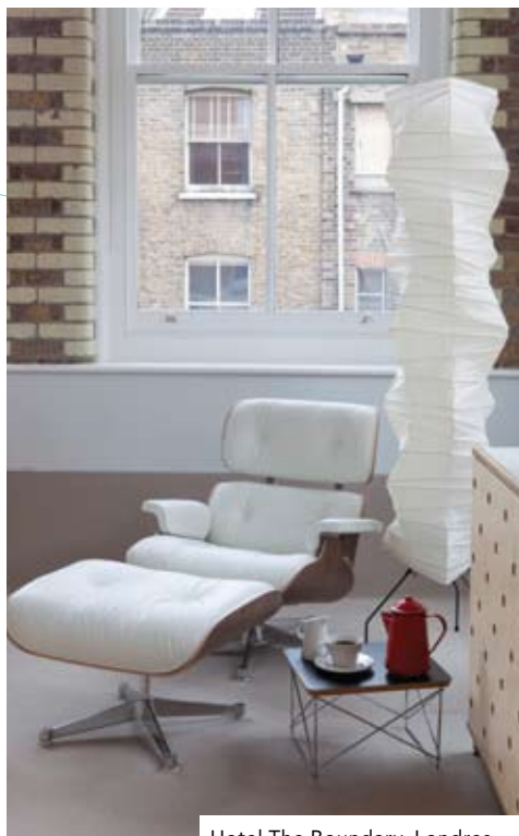
Hotel The Boundary, Londres.