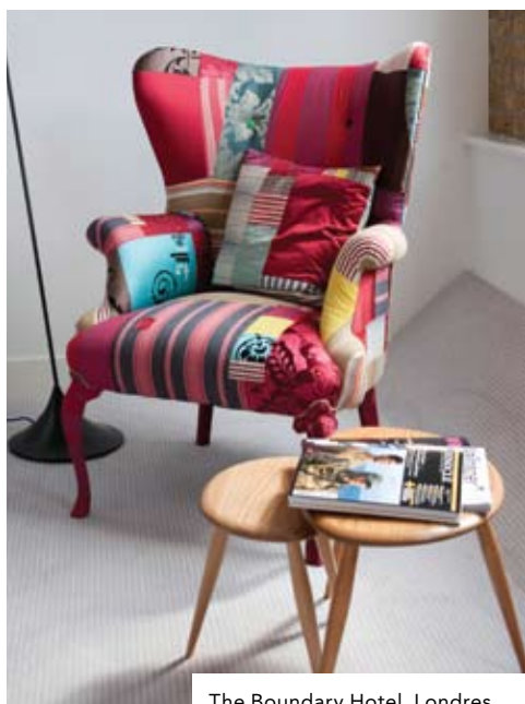
The Boundary Hotel, Londres.