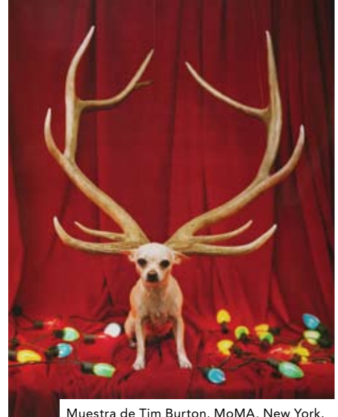
Muestra de Tim Burton, MoMA, New York.

Para cenar alta cocina china, reservar mesa en Mr. Chow (121 Hudson Street). La sucursal de Tribeca es espléndida y está ambientada con obras de Andy Warhol, Julian Schnabel y fotos de Helmut Newton. Entre su clientela, ficha desde Robert de Niro hasta Paris Hilton.