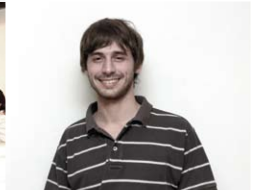
De izq. a derecha: Entrevistando a Marcos Peña, Sec. General de Gobierno (PRO). | Algunos de los jóvenes que hacen "Política Argentina".