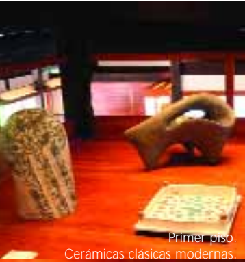
Primer piso. Cerámicas clásicas modernas.

Tokuda Yasokichi III (1933-), Tesoro Nacional Viviente, cuenco de porcelana, colores logrados con 50 a 70 esmaltes distintos