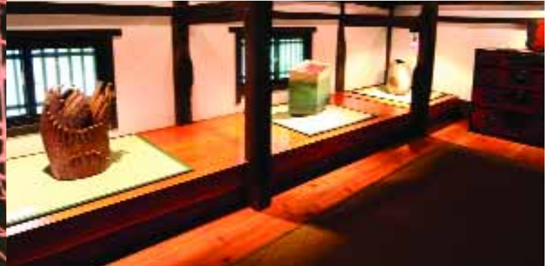
Cerámicas clásicas modernas expuestas en el primer piso.