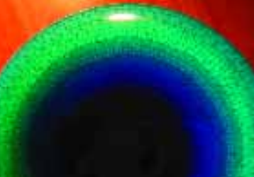
Cerámicas clásicas modernas.

Tokuda Yasokichi III (1933-), Tesoro Nacional Viviente, cuenco de porcelana, colores logrados con 50 a 70 esmaltes distintos