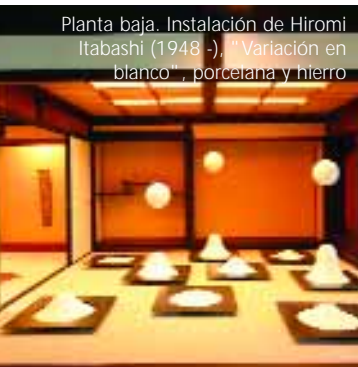
Planta baja. Instalación de Hiromi Itabashi (1948 -), "Variación en blanco", porcelana y hierro

Texto: Julieta García Pena