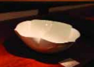
Inoue Manji (1929-), Tesoro Nacional Viviente, cuenco de porcelana en forma de flor.