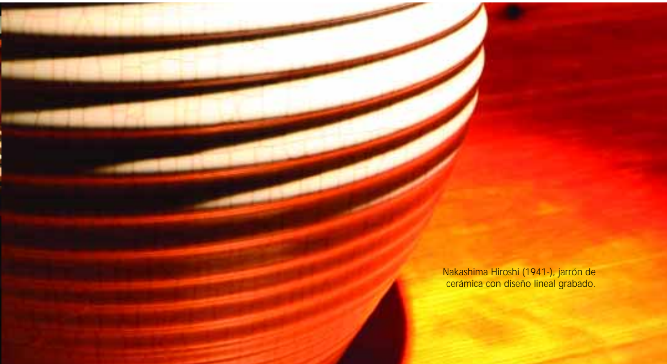
Nakashima Hiroshi (1941-), jarrón de cerámica con diseño lineal grabado.