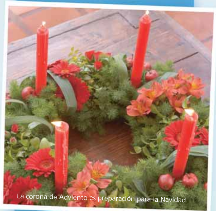
La corona de Adviento es preparación para la Navidad.