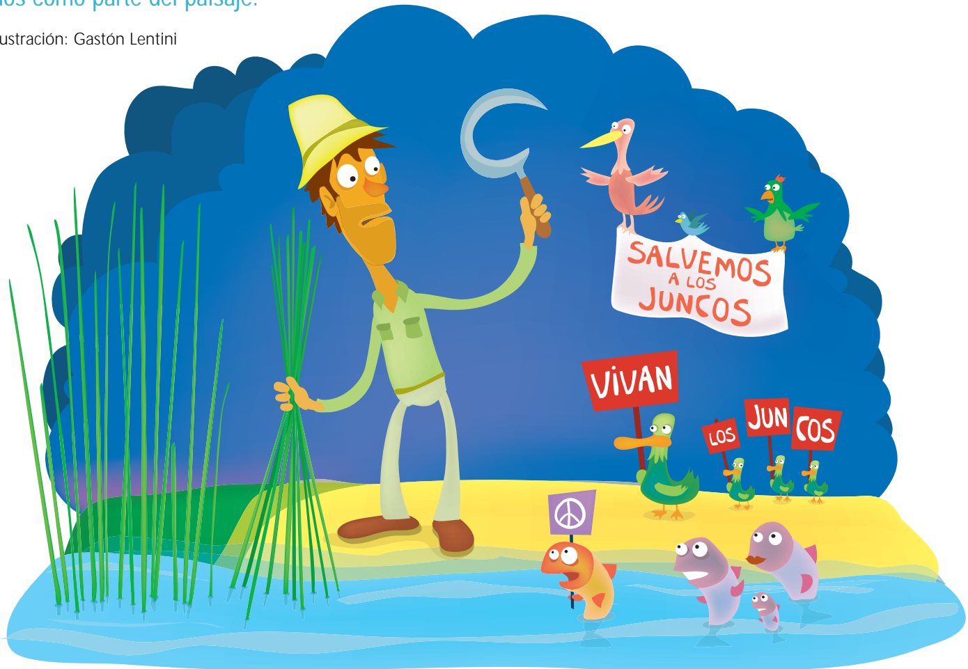
Ilustración: Gastón Lentini

Por ser plantas que sólo se desarrollan en las costas de lagunas, ríos y arroyos, los juncos suelen ser mirados despectivamente por la gente de la ciudad; para los residentes de nuestra zona son incorporados como parte del paisaje.